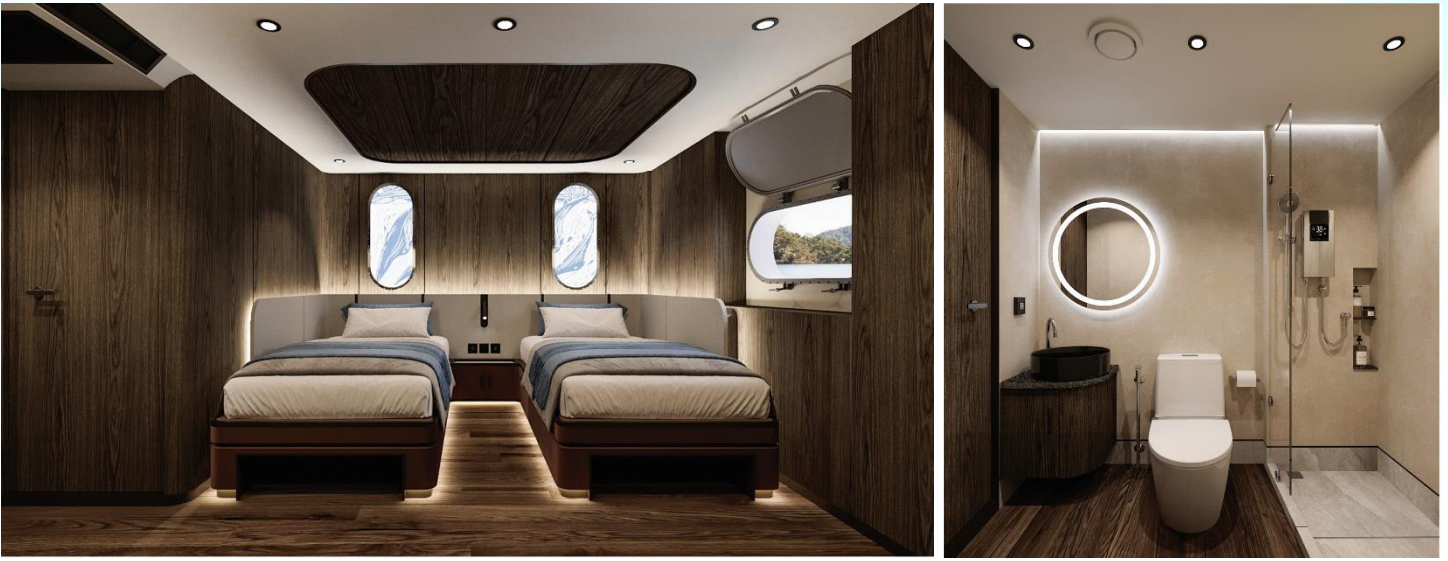
DELUXE ROOM (DELUXE TWIN // DELUXE DOUBLE) ขนาด 17.59 ตารางเมตร